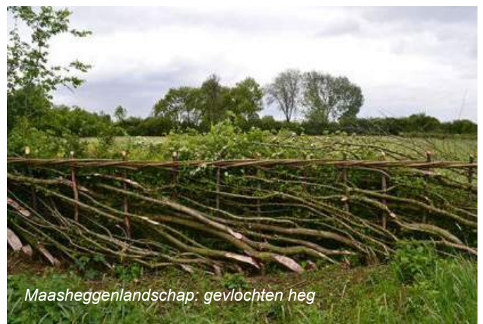
Maasheggenlandschap: gevlochten heg