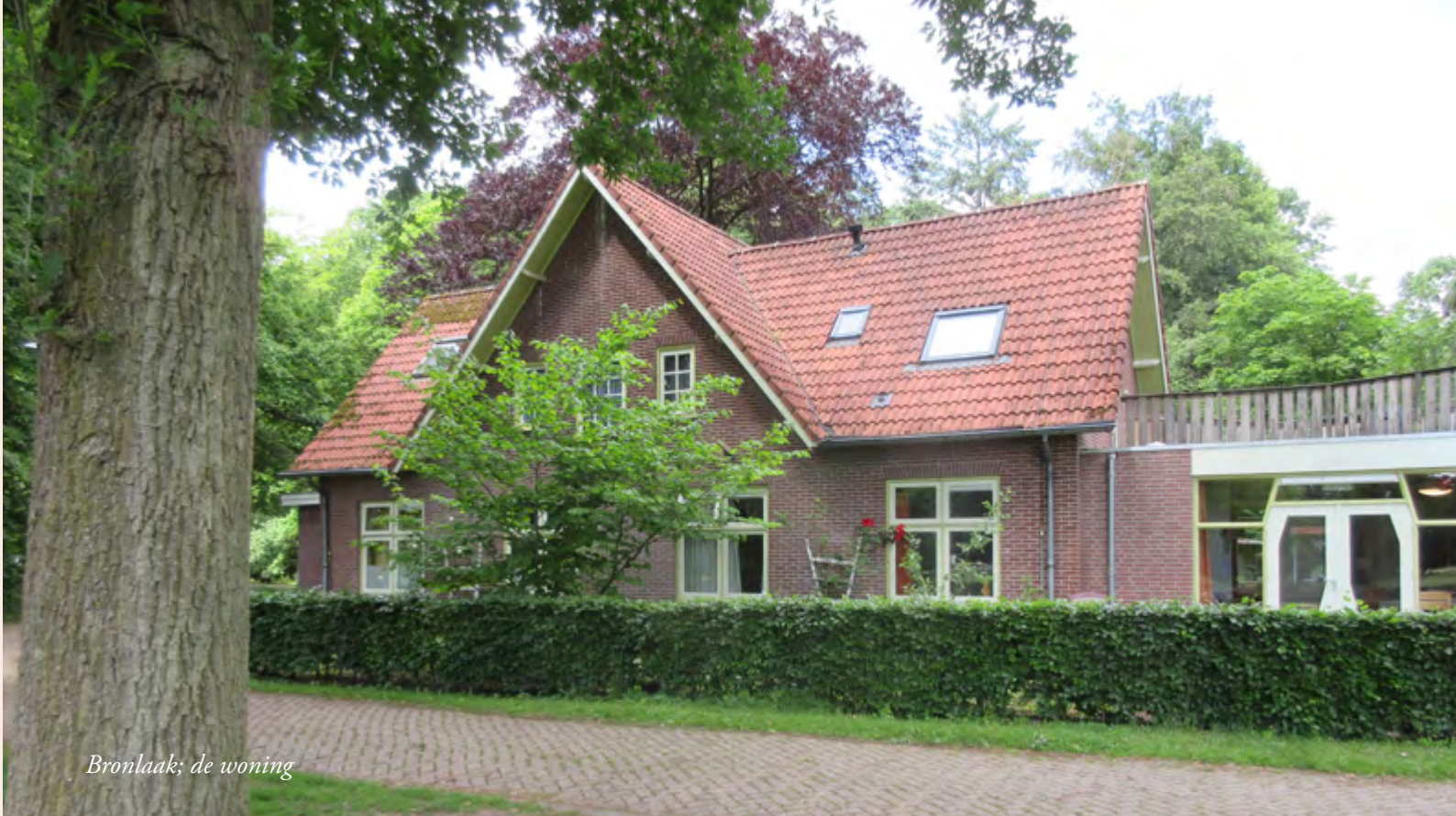
Bronlaak; de woning