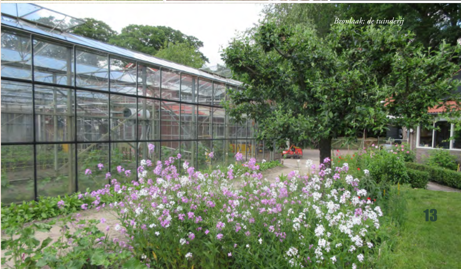
Bronlaak; de tuinderij