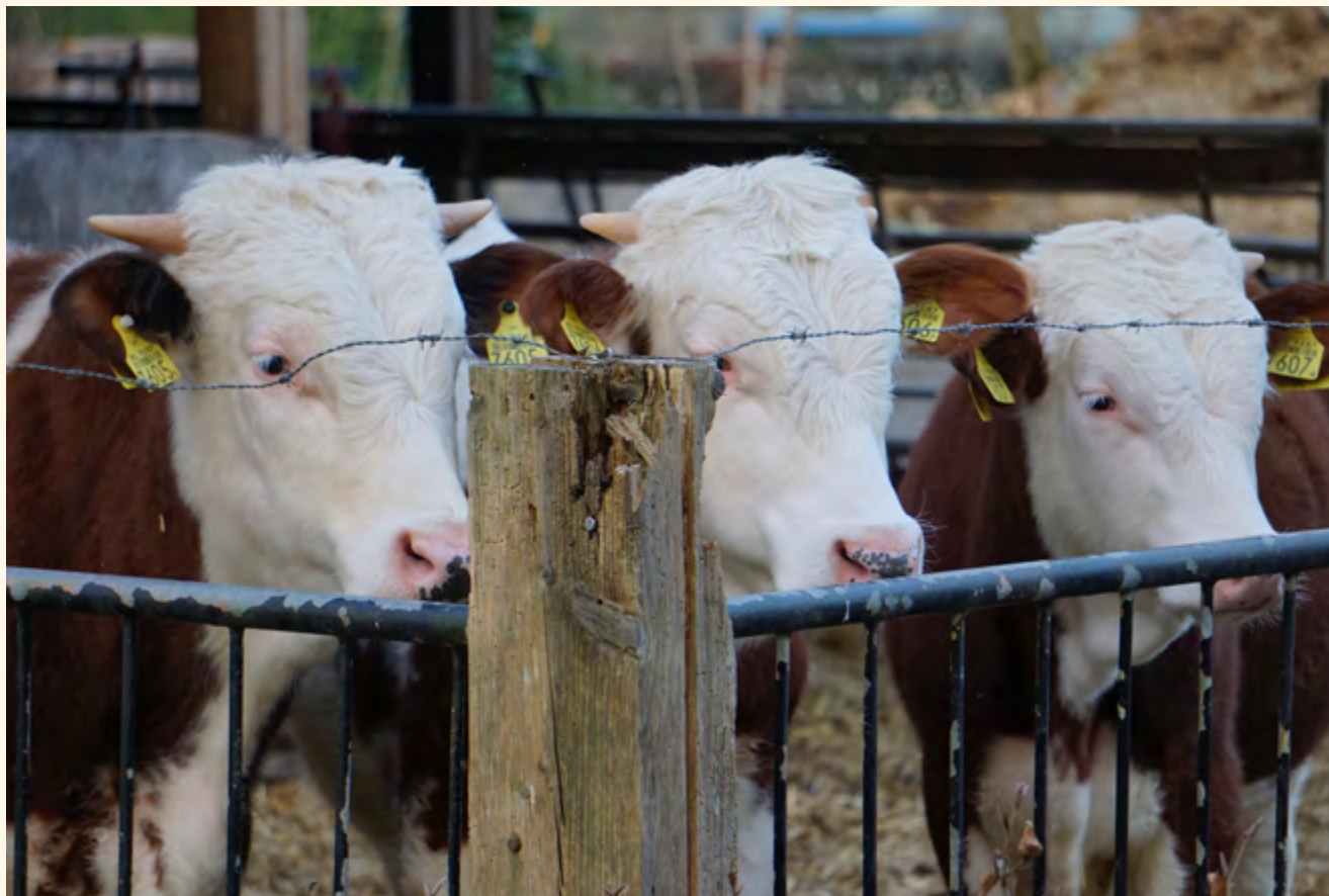
De koeien van Bronlaak

Tuinderij en boerderij Op de tuinderij en de boerderij worden producten geteeld en geproduceerd volgens biologisch dynamische richtlijnen. Een methodiek die in de jaren 20 van de vorige eeuw ontstond. De richtlijnen zijn duidelijk. In de basis werk je aan een optimale bedrijfsvoering waarbij rekening gehouden wordt met het