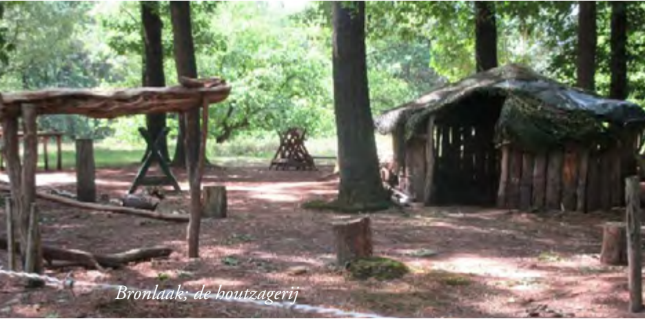
Bronlaak; de houtzagerij