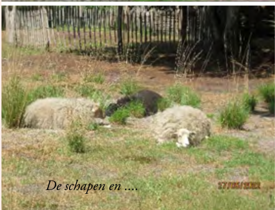
De schapen en ....