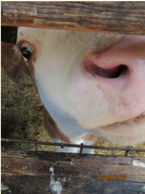
Een heel nieuwsgierig kalfje

De huidige boerderijgroep en tuingroepen staan straks ten dienste van de coöperatie. Bronlaak heeft echter nog meer te bieden. Vanuit de biologisch dynamische landbouw kunnen we op een andere manier naar het landschap kijken. Die kennis kunnen we bieden door onze bos- en hoveniersgroep in te zetten, samen werkend aan het landschap. De kwekerij kan snijbloemen en vaste planten leveren. Oogst kan straks op Ard Lea verwerkt worden tot jam, chutneys e.d. Dit zijn enkele fysieke kanten van het verhaal. Daarnaast zijn er nog de culturele feesten zoals St. Jan, het Michaëlsfeest, Kerstfeest, etc. Ook biedt Bronlaak de mogelijkheid tot bijeen komen voor vergaderingen met eenvoudige catering. Als lid van de coöperatie kan er dus nog een heel andere wereld open gaan als men dit wil. Een wereld om je te verwonderen.