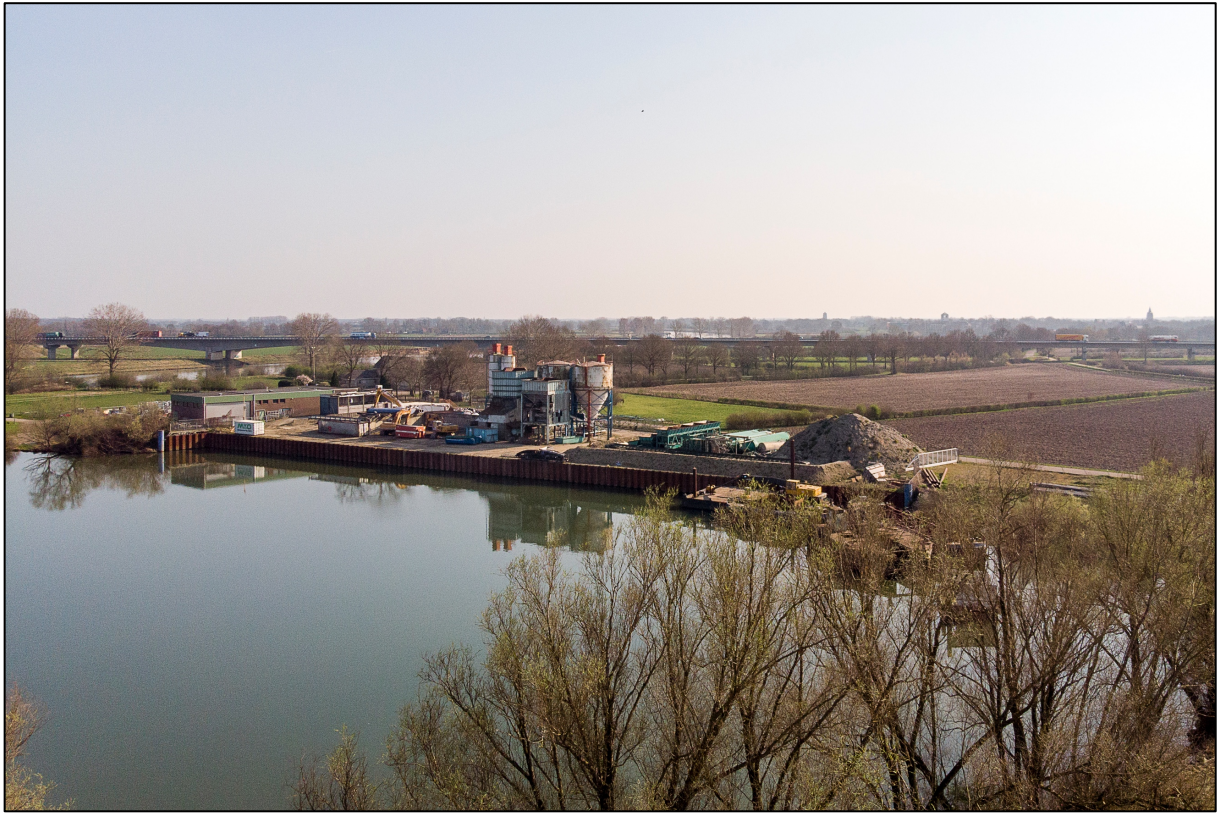
23 maart 2022