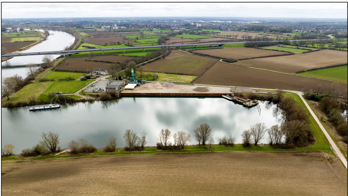
5 maart 2023